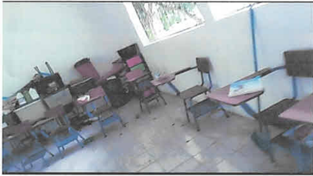
Foto1: Finalización de cernido de Pared